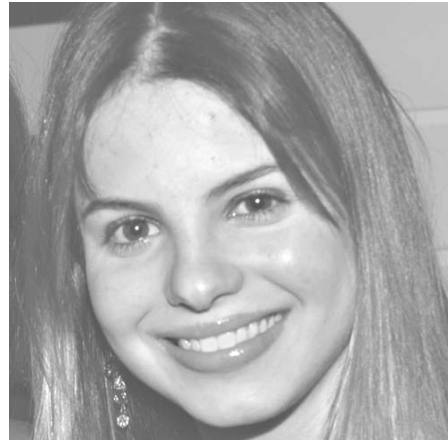
Investimento em novas idéias é uma solução para a crise que a comunidade brasileira vem enfrentando. Muitas operadoras promoveram suas empresas trazendo artistas da Globo, conhecidos dos brasileiros, para incrementar a temporada.

Asa de Águia, Banda Mel ...fizeram parte do repertório de músicas usadas pelos DJs que embalaram as festas. Como convidados especiais, estavam os atores Henri Casteli, Rafael Almeida, Kayky e Stefany Brito que causaram "frisson" na galera. As operadoras falaram do sucesso da temporada e de mais